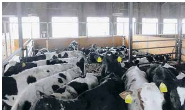
写真1 過密により牛体が汚れる事例

注：「1頭あたりの面積」には採食通路を含まない。 (MWPS第7版フリーストール牛舎ハンドブック)