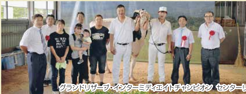
グランドリザーブ・インターミディエイトチャンピオン センターリバー ARK グリット ヨシダサン