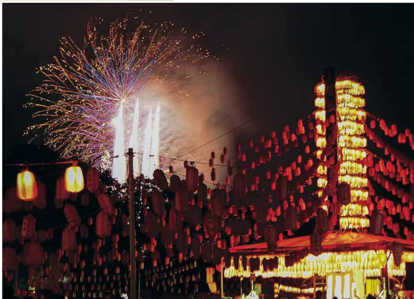
第67回なかしべつ夏祭り (R5.8.12~13)