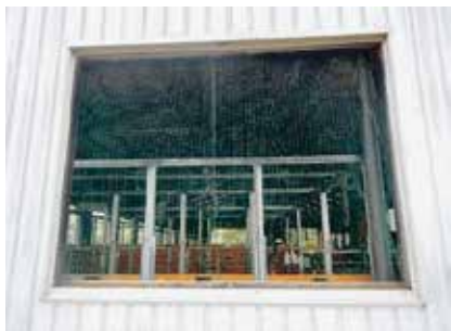
写真3 窓枠を外して換気