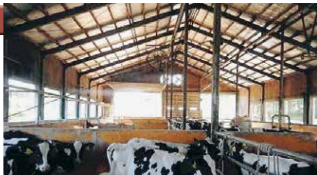
写真2 窓・扉を全開にして換気を行う牛舎