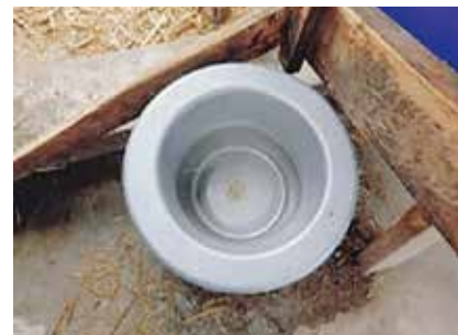
写真5 こまめに掃除した水槽