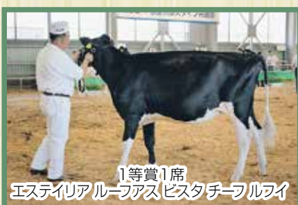
1等賞1席 エステイリア ルーフアス ビスタ チーフ ルファイ