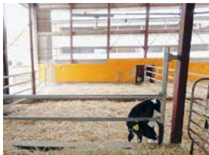
写真4 きれいな牛床管理