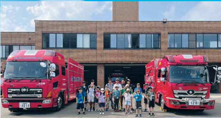
令和5年度 根釧合同ジュニアホルスタインクラブサマースクールを7月26～27日に開催しました。