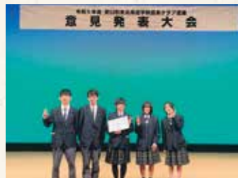
参加者全員で集合写真