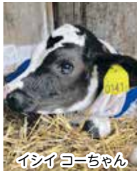
インシヨーちゃん

俣落地区に新規就農して8年目。女性部に入部して6年目になりました。まだまだ仕事と子