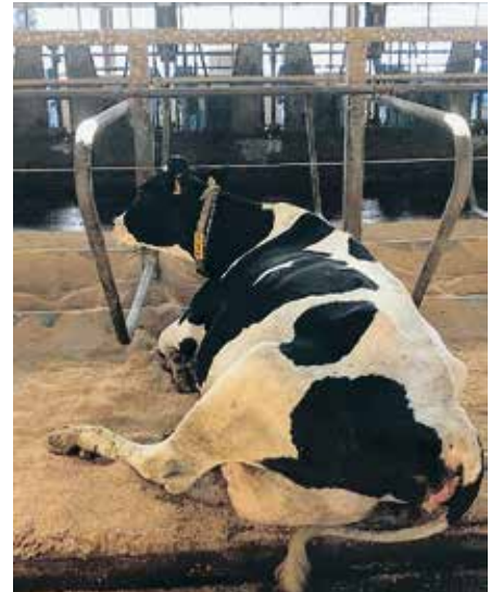
写真1 搾乳牛施設の敷料

また十分な敷料の効果を得るには牛床が乾燥していることが重要です。こまめな除ふん、清掃や換気を行い、牛床を乾燥させるようにしましょう。