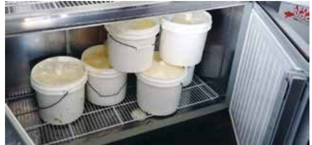
写真1 冷蔵庫内に保存された初乳

搾った初乳や移行乳の保存は細菌の繁殖防止が重要で、バルク乳と同様に4℃以下で冷却保存する必要があります。搾乳後2時間ほど水冷却して余熱をとり、その後、冷蔵保存(写真1)するのが理想です。冷蔵できない場合は、ふたが出来る容器で水冷却します。冷蔵では最大1日保存できます。2日以上保存する場合は、冷凍保存する必要があります。冷凍保存の場合、最大1年ほど保存可能です。