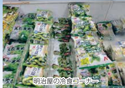
明治屋の冷食コーナー