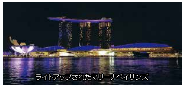
ライトアップされたマリーナベイサンズ

ホテルから専用バスでマレーシアへ行き、ジョホールバルの観光ですが、土曜日は渋滞すると言われている。