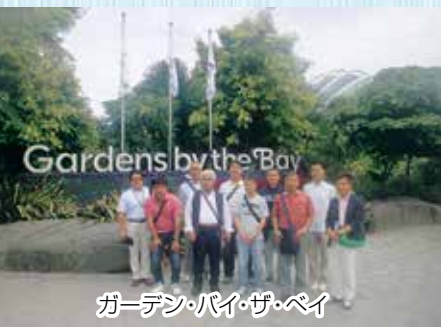
ガーデンズ・バイ・ザ・ベイ

最終日も専用バスでの市内観光となりました。ガーデンズバイザベイ、マリーナベイサンズを見学後、昼