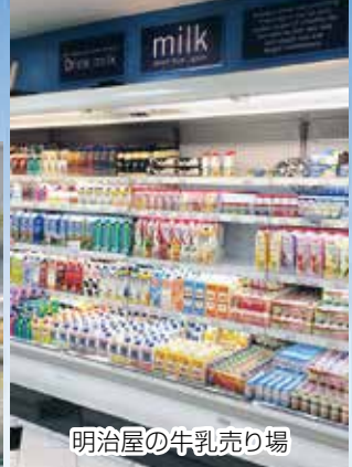
明治屋の牛乳売り場