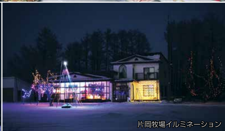
片岡牧場イルミネーション