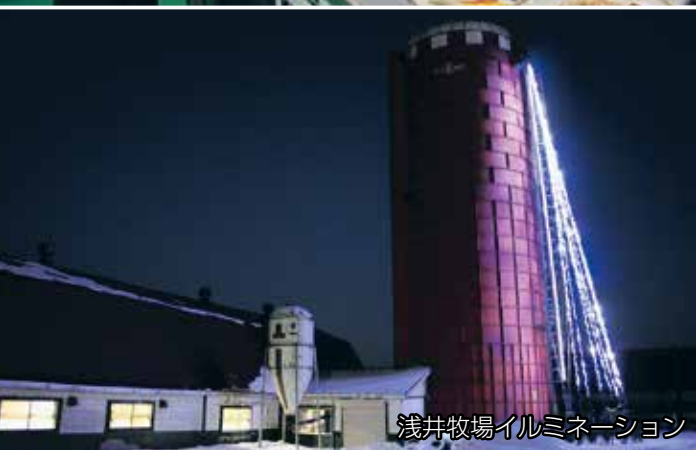
浅井牧場イルミネーション