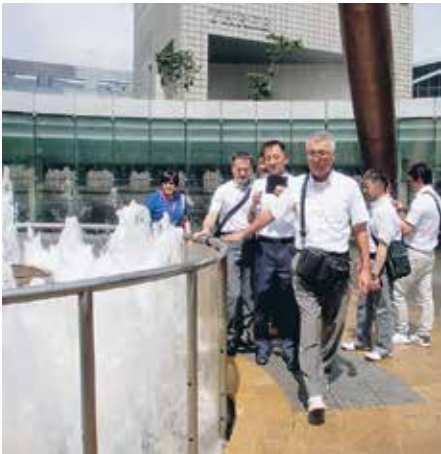
富の噴水 (ファウンテン オブ ウェルス)