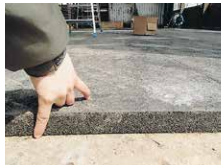
写真 底冷え対策でマットを敷設