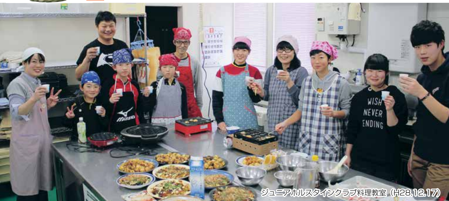
ジュニアホルスタインクラブ料理教室 (H28.12.17)