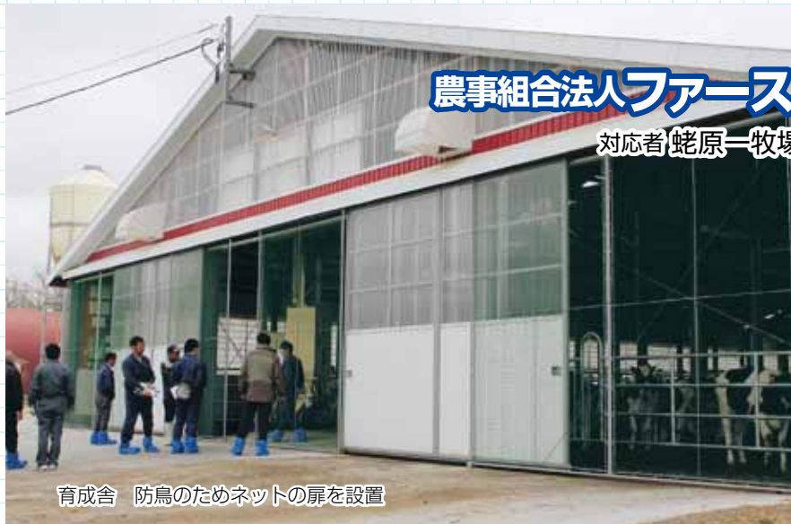
JA忠類との意見交換