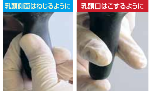
写真2 乳頭清拭は2工程ある

真2)。とくに乳頭口をより丁寧に拭くことは、乳牛にとってより強烈な搾乳刺激になります。