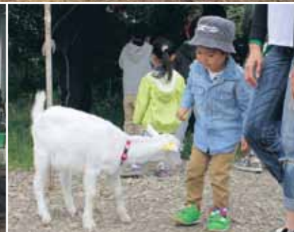
2015 JAなかしべつ牛まつり&共進会 (2015.6.6)