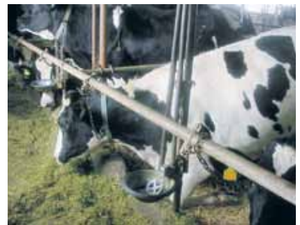
写真4 寝起きの途中でこの姿で一度止まる場合は牛床構造に原因がある