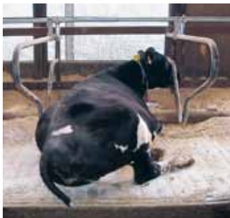
写真3 牛床幅を10cm広げて130cmにしたときの休息姿勢（乾乳牛）

同じエサでも採食量や乳量が高い牧場では、牛舎内でも写真1のようにゆったりとした休息姿勢を示す牛が多い傾向にあります。