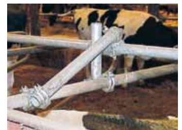
写真5 ネックレールを上げた事例

なお牛舎改造事例の詳細は、今年2月発行の営農改善資料「牛の行動から考える牛舎施設」が各戸に配布されていますのでそちらをご覧ください。