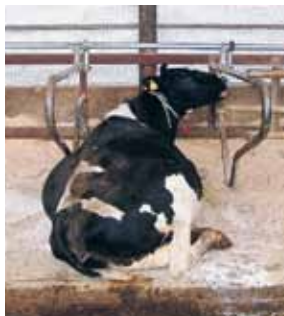
写真2 コンパクトな休息姿勢