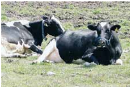
写真1 ゆったりとした休息姿勢

休むことが充実すると、次に続く採食、移動、飲水行動への動機付けにつながり、結果として採食量と乳量が増加します。