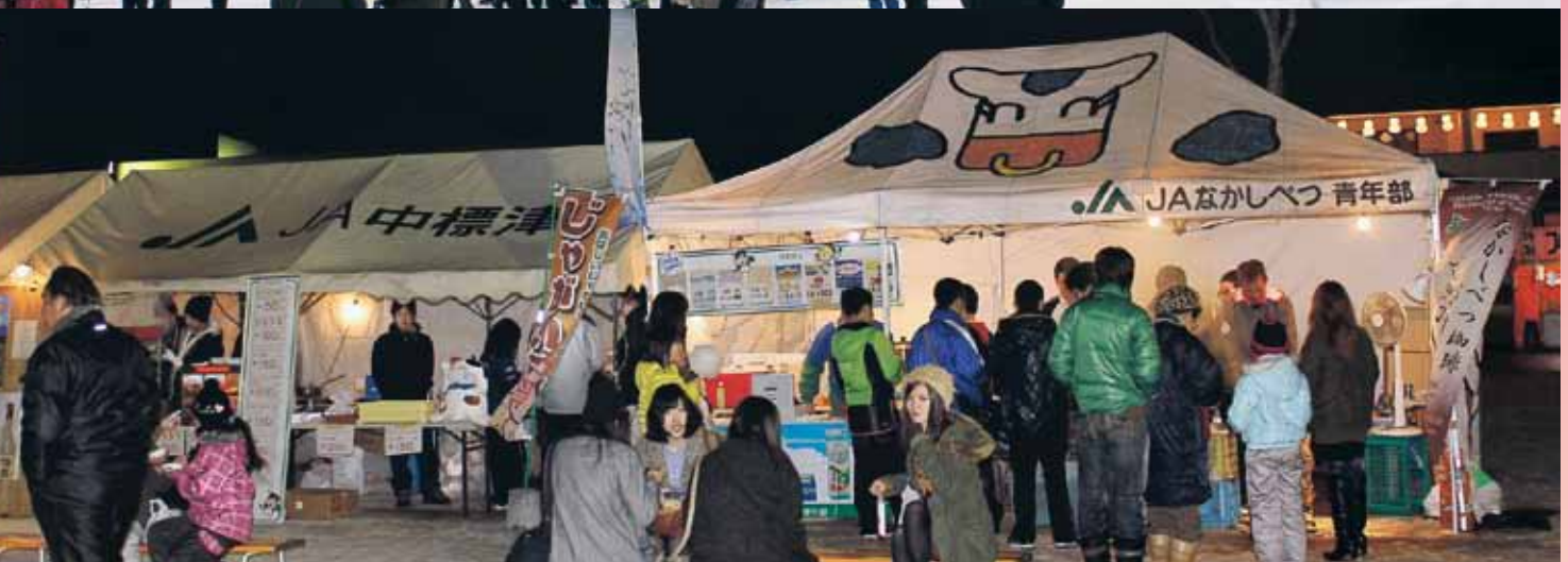
第38回なかしべつ冬祭り (2013.2.2~3)