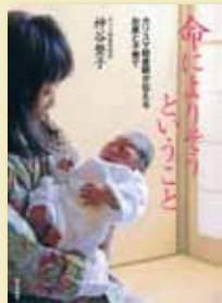
神谷整子 著 定価1,365円(税込)

多くのお産や育児をサポートしてきたカリスマ助産師が授ける、出産・育児のアドバイス集。妊婦さんや産婦さんの不安について、確かな経験にもとづいた知恵を伝授。出産の素晴らしさ、育児の大切さがよくわかる。