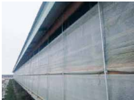
写真2 壁面のカーテンを開けて入気口として、窓や壁面のカーテンを開けることで牛に直接風が当たらない

せん。入気口として、窓や壁面のカーテンを開けるなどして換気を図りましょう(写真2)。