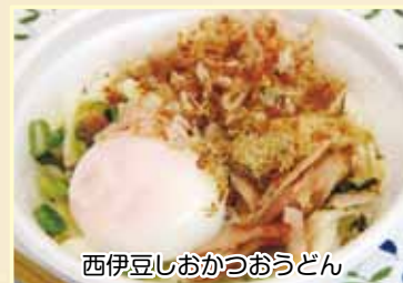
西伊豆しおかつおうどん

「西伊豆しおかつお研究会」は、日本で唯一西伊豆だけで作られている縁起の良い伝統的な保存食「しおかつお」を使った「西伊豆しおかつおうどん」で、まちおこしを行う有志の会。カツオを丸ごと塩に漬け込み乾燥させて作る「しおかつお」をよ