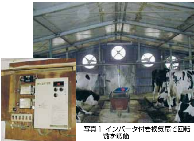
写真1 インバータ付き換気扇で回転数を調節

トンネル換気の牛舎では、夏期間より換気扇の台数を制限して稼働したり、インバータ付き換気扇で回転数を調節し、ゆっくり継続的に湿気や臭気を排出します(写真1)。換気量を多くしすぎると水周りが凍結しますので、外気温に応じて換気扇の稼働時間や入気口の位置を調節して下さい。冬の換気用として、高い位置(入気側の扉の上)に入気口を設置し、*外気が直接牛に当たるのを防いでいる事例もあります。