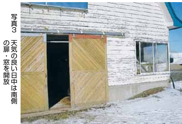
写真3 天気の良い日中は南側の扉・窓を開放

天気の良い日中には、南側に面した牛舎の扉や、窓を積極的に開放し、牛舎内の換気に努めましょう。