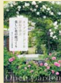
「花ぐらし」ガーデニング倶楽部 編 定価1,470円(税込)

一般公開しているプライベートな庭の案内と、その庭づくりのアイデアを写真とともに紹介。ナチュラルな植栽の庭、小さな空間をバラで彩る庭など、庭の特徴別に紹介。目的に合った庭造りにいけるアイデアが満載。