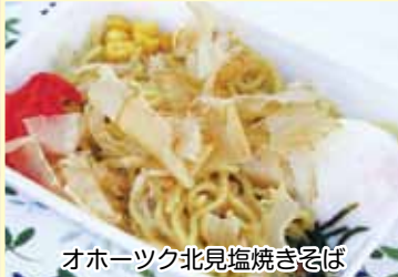
オホーツク北見塩焼きそば

豊富な農林水産資源で地域を元気にしようと市民が立ち上げた「オホーツク北見塩焼きそば推進協議会」。生産量日本一を誇る北見のタマネギ、サロマ湖産ホタテ、さけ節、北海道産小麦を主原料にした麺、オホーツク海の天然塩などを使うことで生まれた「オホーツク北見塩焼きそば」。具材は食べやすい大きさに切って軽く炒め、麺を加えて炒め、決め手の干し貝柱のだしを利かせた特製塩ダレで味付け、さけ節と温泉卵を飾って完成です。