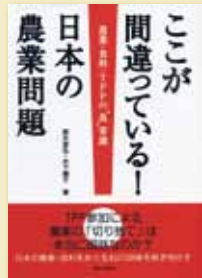
鈴木宣弘、木下順子 著 定価800円(税込)

一部の大企業やメディアにより、日本の農業についての事実とは違った世論が形成され、それによる批判が展開されている。本書は日本の食料・農業についてこれまで伝えられてきた誤解をわかりやすく解き明かす。