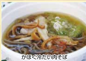
かほく冷たい肉そば

河北町を愛する仲間が集まり、「かほく冷たい肉そば」を通して町を元気にしようと活動している「かほく冷たい肉そば研究会」。「かほく冷たい肉そば」は、大正時代から愛され守られてきた郷土食で、山形県河北町のみで食べられてきた冷たい親鶏のだしが特徴です。コクのある冷たいだしにコシの強い田舎そば、歯応えのある食感が癖になる煮込んだ親鶏を載せ、地元野菜のネギ、ホワイトタイガーを刻んで薬味に入れています。