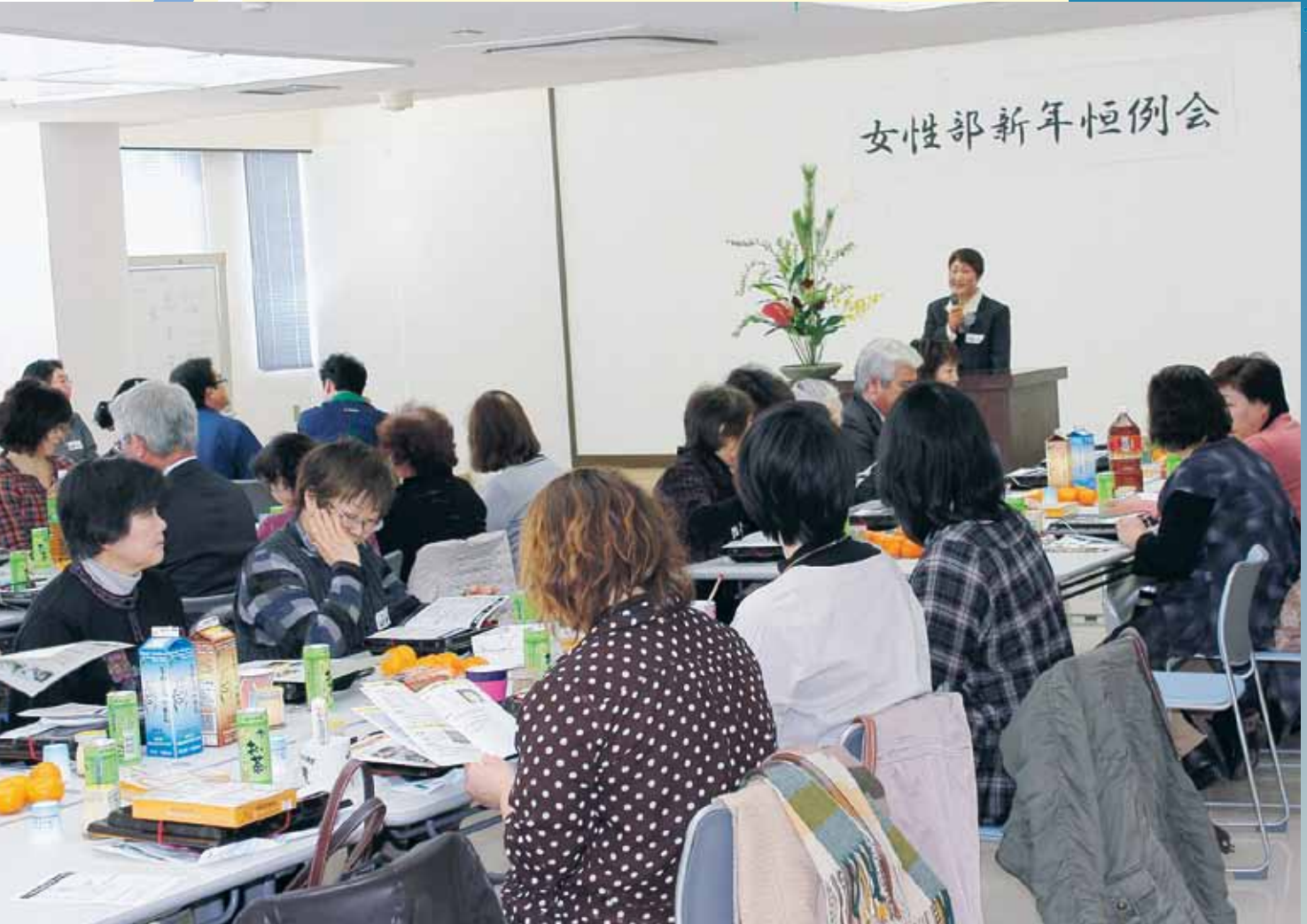
女性部新年恒例会