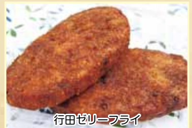
行田ゼリーフライ

埼玉県行田市内で100年近く愛され続けているゼリーフライで、地域の活性化とまちおこしを目的に発足した「行田ゼリーフライ研究会」。行田は水が良く、豆腐作りが盛んだため、上質なおからが身近にありました。おからと蒸したジャガイモ、ネギとニンジンのみじん切りを混ぜ合わせ小判形に成形して素揚げし、それをウスターソースにくぐらせ出来上がり。小判の形から、銭フライ、ゼリーフライと昭和初期から呼ばれています。