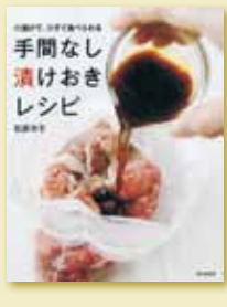
石原洋子 著 定価1,260円(税込)

朝漬けておけば、夜にはささっと調理でおいしいおかずのできあがり。ジッパー付き保存袋に食材と漬けだれを入れるだけ。下ごしらえも簡単。なうえ、少ない分量の漬けだれでOK。夜漬ければ朝のお弁当に大活躍。