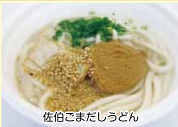
佐伯ごまだしうどん

大分県佐伯市を全国に広めようと「佐伯ごまだしうどん」を通じ、「大作戦」と銘打ったさまざまなPR活動を行うボランティア団体。旬の魚を焼いて身をほぐし、みりん、濃い口と薄口を合わせたしょうゆ、ごまをすり鉢ですった「佐伯ごまだし」をゆ