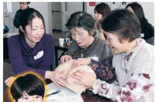
模型の中のしこりを探します。

て足が温かいという状態が大事になるそうです。今日からできる冷えとり健康法として、半身浴や足湯の方法と適した服装の紹介がありました。また、24時間の半身浴が難しいことから、絹や綿などの靴下を重ね履きする靴下療法を取り入れたり、身体を温める食べ物を食べたりする方法などについて紹介がありました。