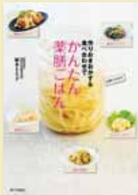
植木もも子 著 定価1,260円(税込)

身近な野菜や乾物で作る「おかずの素」を使って簡単に手軽にできる「薬膳ごはん」レシピ集。健康効果の高まる調理法や相性の良い食材の食べ合わせも紹介。時間がなくてもすぐにできて、その効果は抜群。