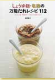
荻野恭子 著 定価1,050円(税込)

あらゆる調理にうまみと深みを加え、仕込んだ3日後から使える「万能だれ」、「しょうゆ麹」、「塩麹」の作り方と、「漬ける」「あえる」「加える」「かける」といった、使い方に合わせて選べる112レシピ。