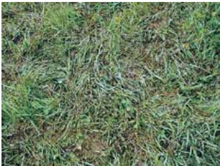
写真2 スラリー散布が遅すぎる事例