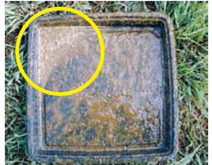
写真3 サラットとなるまで加水した事例

加水すると肥料成分も薄まります。成分を普及センター等で分析して把握することをおすすめします。