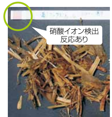
写真4 散布量が多すぎて硝酸イオン反応が見られたサイレージ

局所的に過剰散布にならないよう、なるべく多くの草地に分散して散布します。また、極端な重複散布にならないよう、列の間隔を空けて草地に散布します。散布量の比較では、ヘクタールあたり約10tでは問題ありませんでしたが、約30tではサイレージの発酵品質に悪影響(アンモニア態窒素/全窒素が8%以上、酪酸も検出)や硝酸イオン検出反応がありました(写真4)。