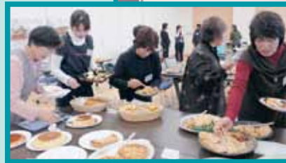
持ち寄った加工食品を参加者全員で試食。逸品揃いですね!!