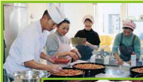
バラ寿司(生ちらし)今回はサーモンといくらの親子寿司です。