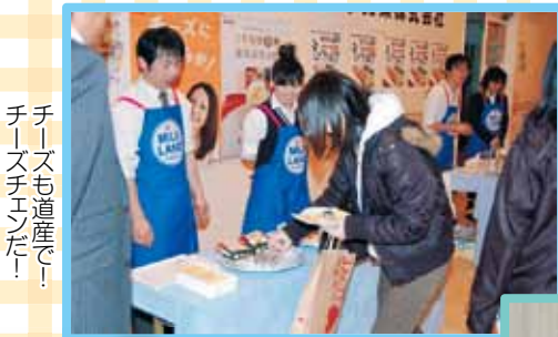
チーズも道産で! チーズチェンだ!