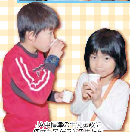
JA中標津の牛乳試飲に 何度も足を運ぶ子供たち