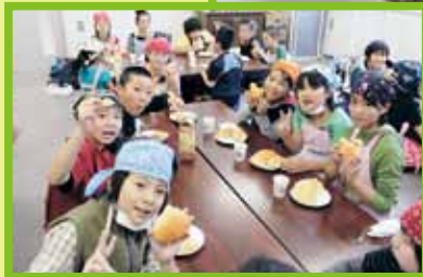
出来たパンは何の形!?