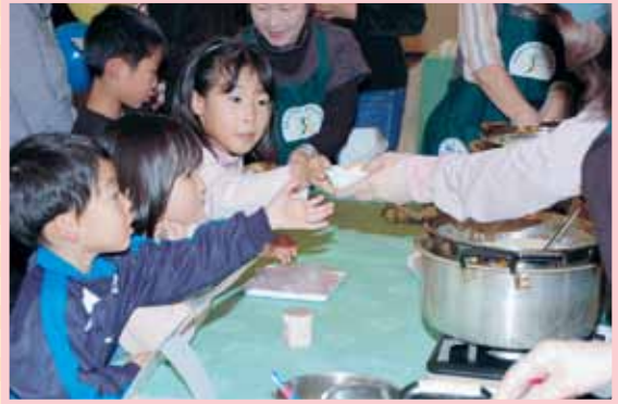
地区女性協よりミルクスイーツコーナー。 子供たちの列が絶えません!