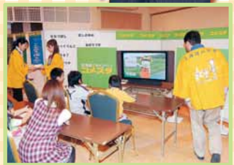
北海道米ブースでは食べ比べイベントや 北海道米クイズもありました。