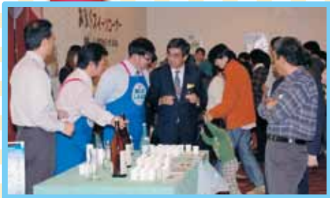
北海道米の酒。酒チェンしよう!