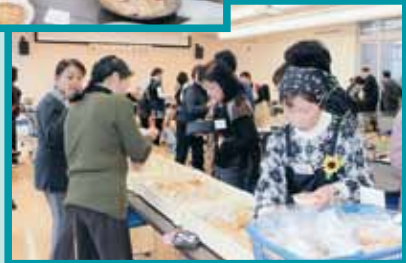
加工部会の販売品目も飛びように売れました。