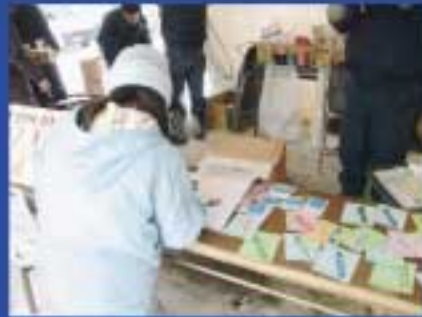
牛乳消費拡大推進委員会のぬりえでストラックアウト

ぶり伯爵いもを使った「牛乳しるこ」などを提供し、「白いプリン大作戦」にも協力、町内2、標津1、根室2の各お菓子屋さんにも協力いただき、セツト販売しました。ちびっこ向けに企画した2日目のアイスクリーム作りは、参加希望がなくて中止となりましたが、売上は上々。食品加工交流部会では1日目のみの出店となりましたが、菓子パンを販売。瞬間に売り切れとなったようです。マリンスファームでは、じゃがいもの焼きいも、おでんなどを温められるメニューを多数取り揃え提供。酪農課では、フランダーズさんと共同開発しているじゃがいものスイーツポテトを初お目見えで販売、用意した約300個がどんどん売れていきました。 イベントでは寒さを吹き飛ばす、よさこいソーランの舞いやストラックアウト、スーパードッジボール大会などで盛り上がりました。 冬まつりにご協力いただいた方々、有難うございましたお疲れ様でした。