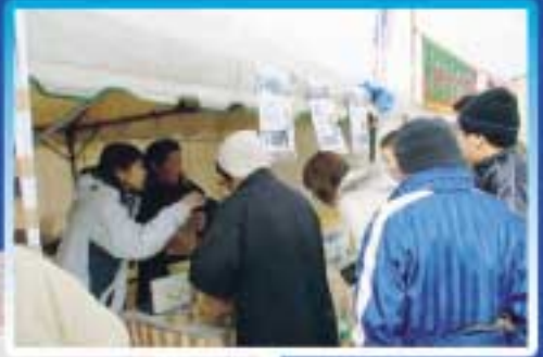
加工部会のパン販売