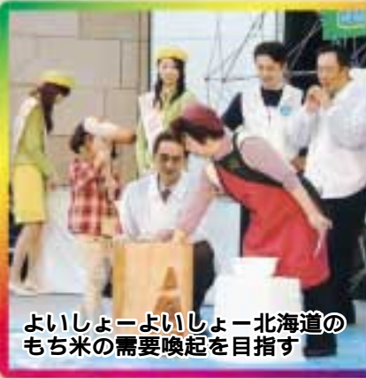
よいしょーよいしょー北海道のもち米の需要喚起を目指す