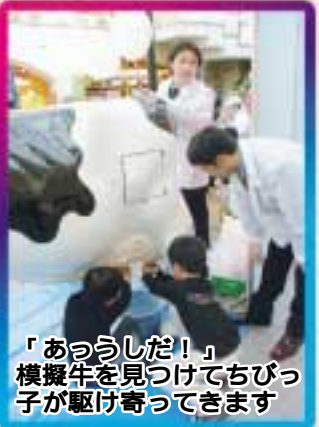
「あっうした!」模擬牛を見つけてちびっ子が駆け寄ってきます