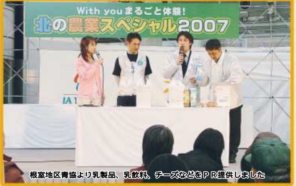
根室地区青協より乳製品、乳飲料、チーズなどをPR提供しました