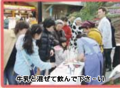
牛乳と混ぜて飲んで下さ~い