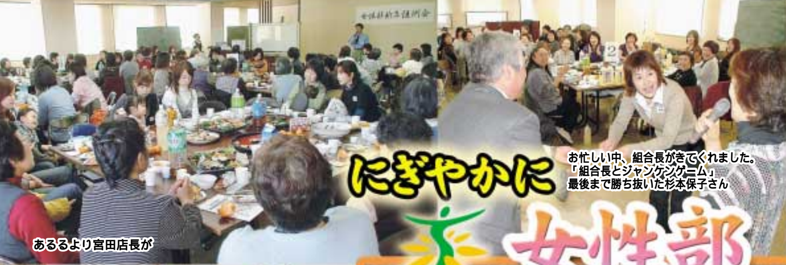
あるより宮田店長が