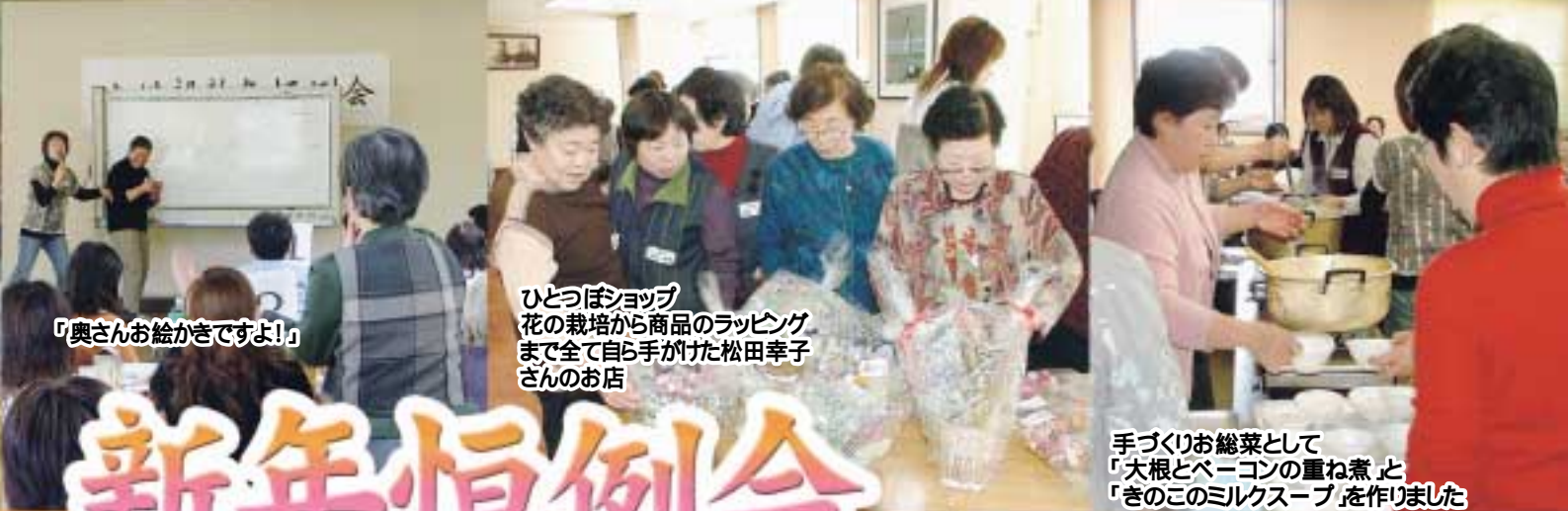
「奥さんお絵かきですよ!」