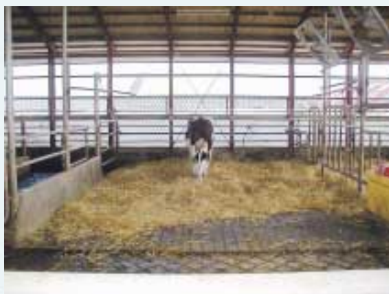
写真2 清潔で自由な分娩房

ポイントは乾乳前期までに十分にカルシウムを摂取させ、乾乳後期にカルシウムを制限することで、Ca/P比を逆転させることです。