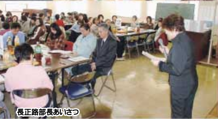
長正路部長あいさつ