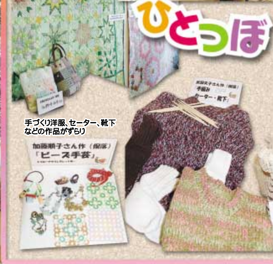
手づくり洋服、セーター、靴下 などの作品がずらり