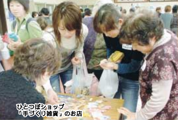
ひとつぼショップ 「手づくり雑貨」のお店