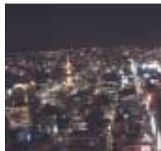
JRタワーからの眺め