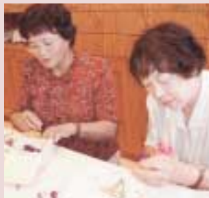
ゆにガーデン ステキなお花畑を作りました

8月24日、札幌、小樽、3日間の研修旅行に参加させて頂きました。根室・中標津空港から千歳空港着の直行で、千歳のアウトレツトモール レラで2時間の自由行動でショッピング。広い商店街でした。