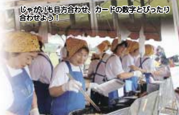
女性部揚げ物カラッと揚げて！