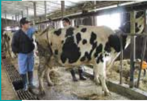
授精師とのコミュニケーションも大事