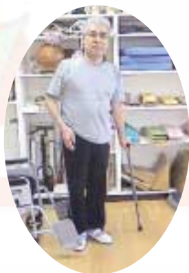
階段の昇降などのリハビリにはげむ組合長