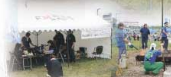
根室、釧路へ電波も飛んだ ラジオ局ブース