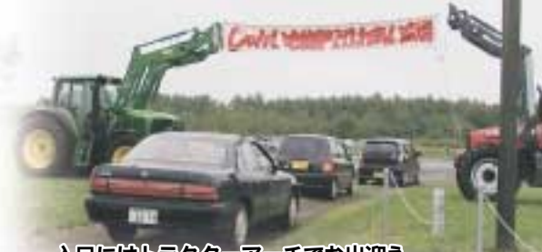
入口にはトラクターアーチでお出迎え