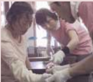
小樽市、ケース・ブローイング ガラスの飲み口を広げているところです

ガラス工芸体験では、あまりの熱さに驚きました。職人の方に手伝ってもらいながら、何とか作品が出来