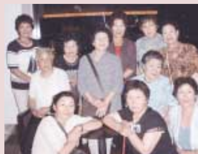
JRタワー キレイな夜景に感動

8月24日、中標津空港より千歳に着き、バスでアウトレツトモール レラへ。私たちは目の正月。色々なお店がずらり、あちこち、物色、品定め。値段、デザインとも目の飛び出そう。「ワア、素敵。でも、ちょっと若すぎるかな？」などひと巡り、なんとなく気に入ったTシャツと上着をゲット。そちこち歩き回ったので、目印の時計出口はど