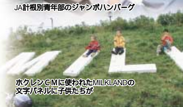
ホクレンCMに使われたMILKLANDの 文字パネルに子供たちが

町商工会青年部と当農協青年部が主催する、「じゃがいも伯爵まつり&ふれあい広場」が9月10日に開かれ、会場となったゆめの森公園 翼とふれあいのゾーン特設会場には、大勢の家族連れなどで賑わい、じゃがいも掘りなどで秋の1日を楽しみました。