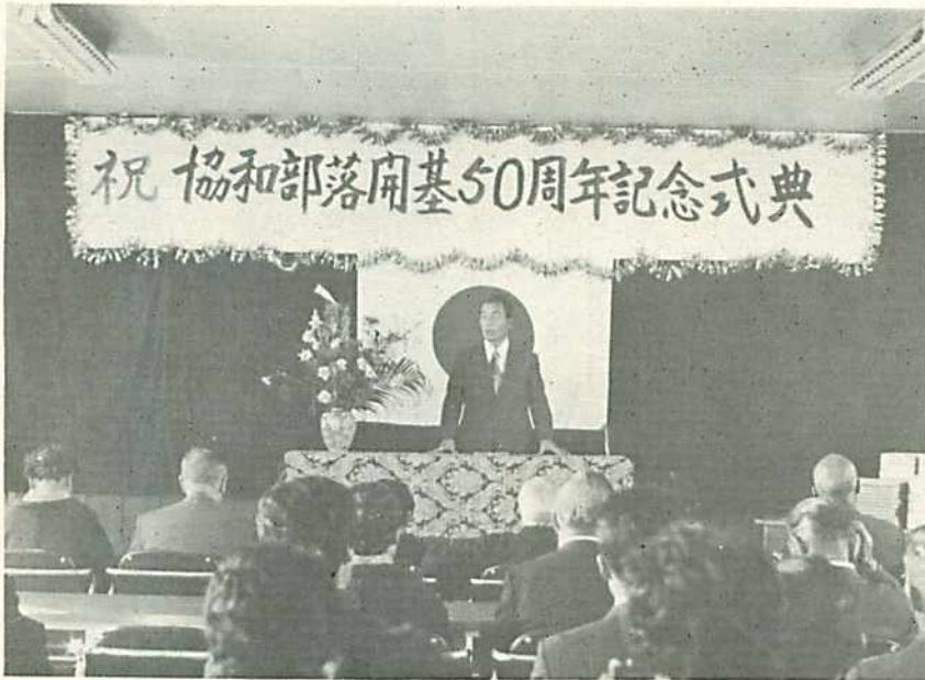
開基50周年記念式典