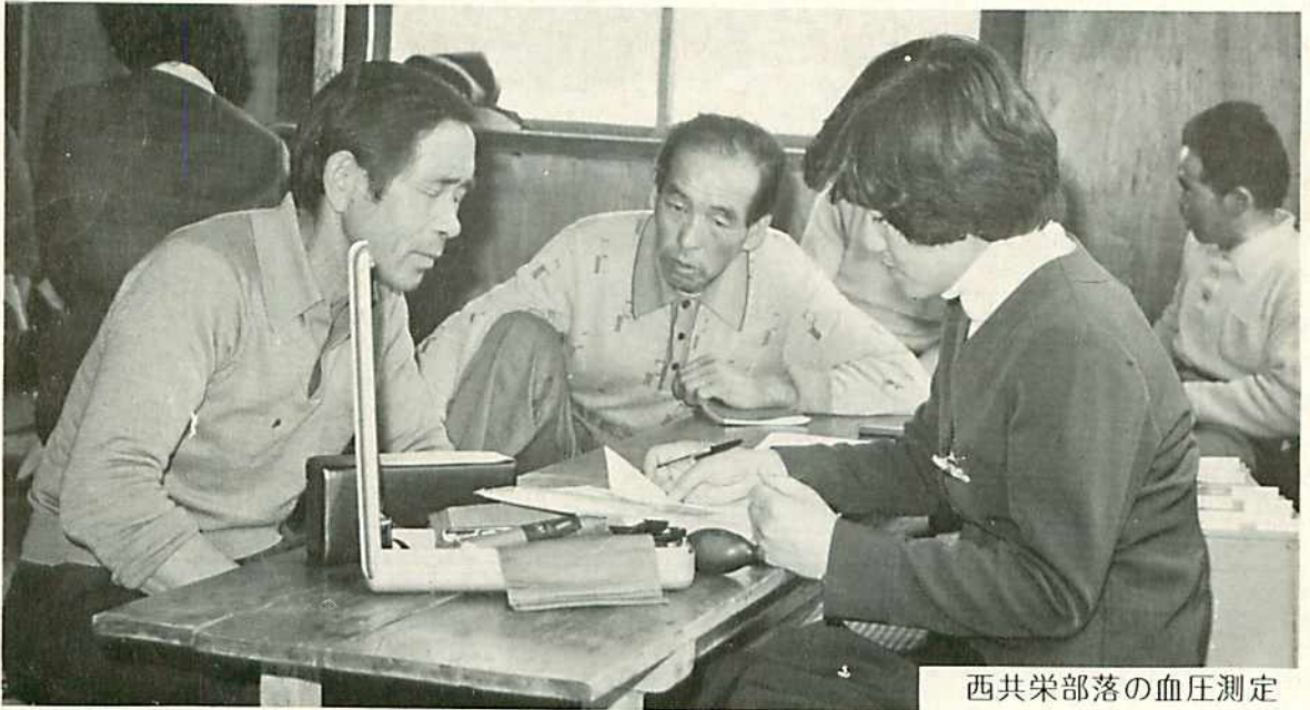
西共栄部落の血圧測定

発行所 中標津農業協同組合・中標津町農業共済組合 発行 昭和53年5月 第47号 印刷・アート印刷株式会社