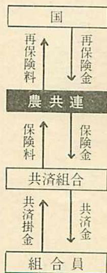
図表 共済関係の仕組み

この仕組みは農業災害補償法によって定められているわけですから、家畜共済関係で、死亡したり廃用になったり、あるいは病気でみてもらつたという場合、その書類はすべて、この事業所に送られ、まずこゝでチェックされるわけです。