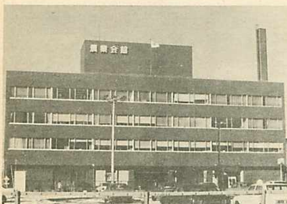
農共連の事務所がある釧路農業会館 (黒金町)