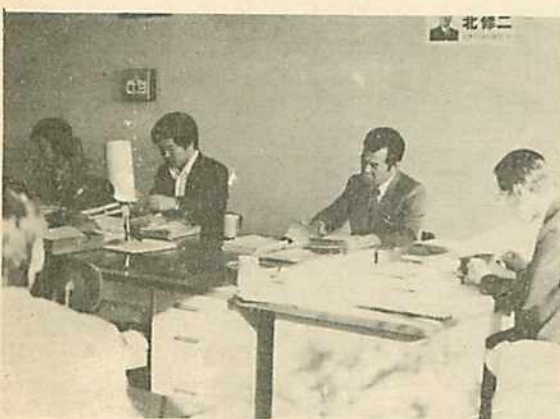
根釧管内の共済組合からの書類はこゝでチェックされる。