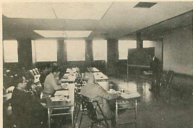
事故処理等の説明を熱心に聞く