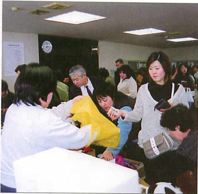
リサイクルバザーも大盛況