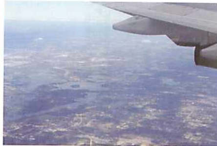
世界で1番頑張っているのは飛行機の翼なのではないか？ 初めての長距離フライトで思う

29日千歳空港に集合し空路にて羽田空港へ、そこから成田空港へと向かい再び空路にてアメリカ合衆国ミシガン州シカゴ市デトロイト空港へと向かいました。移動中の機内はほぼ満席で初め