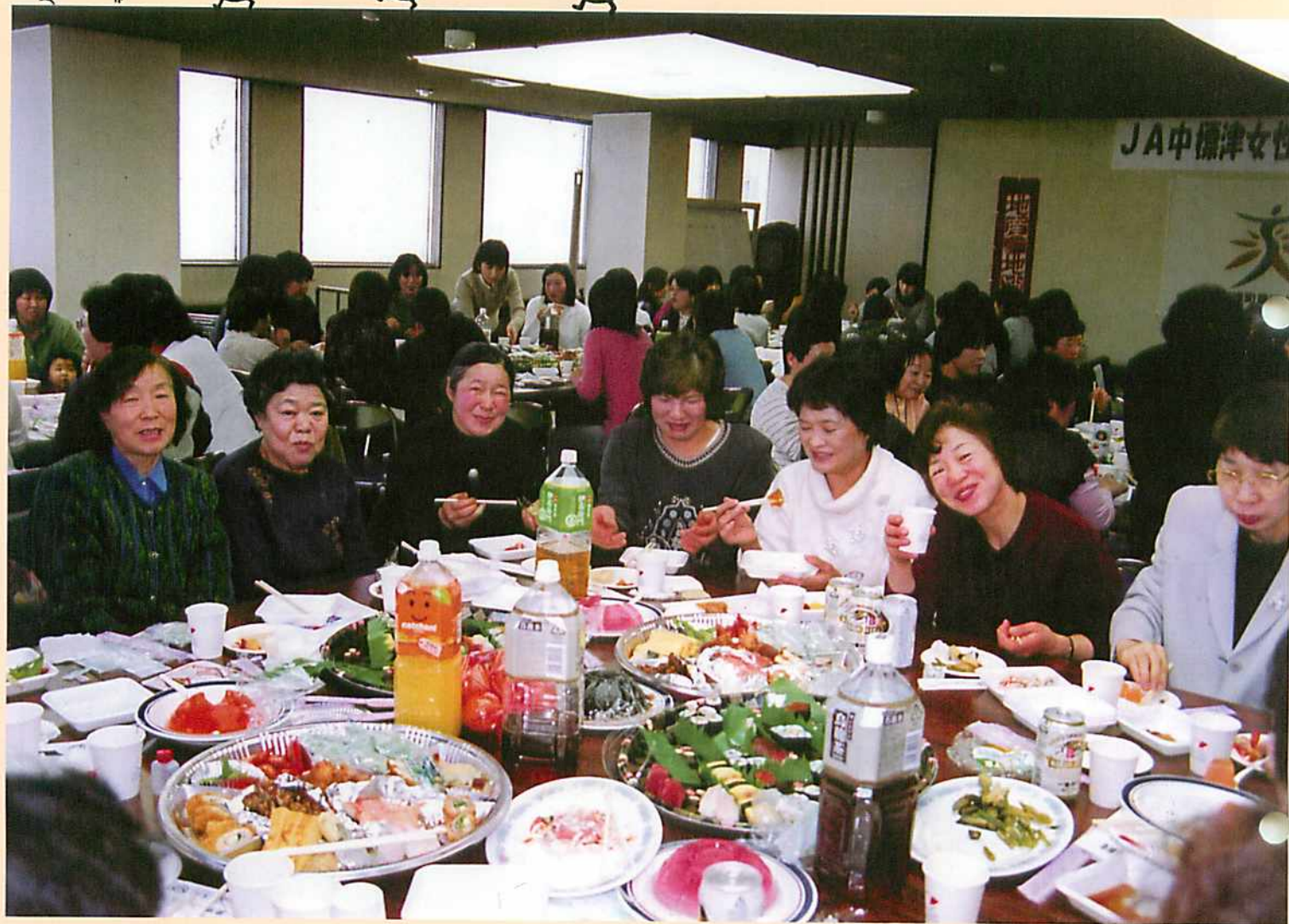
女性部新年恒例会