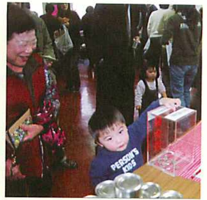
子供達も募金に協力してくれました