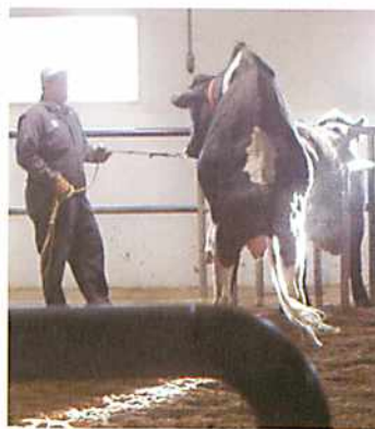
採精の様様 偽牝牝台は用いずに去勢されたアンガス牛を使う

他の2事業所と連携を取り合っており、国内外へと流通しているとの事でした。採精業務は月曜、木曜の週2回(午前6時~9時)で我々が訪れたのはちょうど木曜ということもあり、採精を見学させてもらう事になりました。偽牝牝台を用いずに去勢牛を巧み