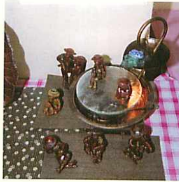
▲部員の作品がすばり…