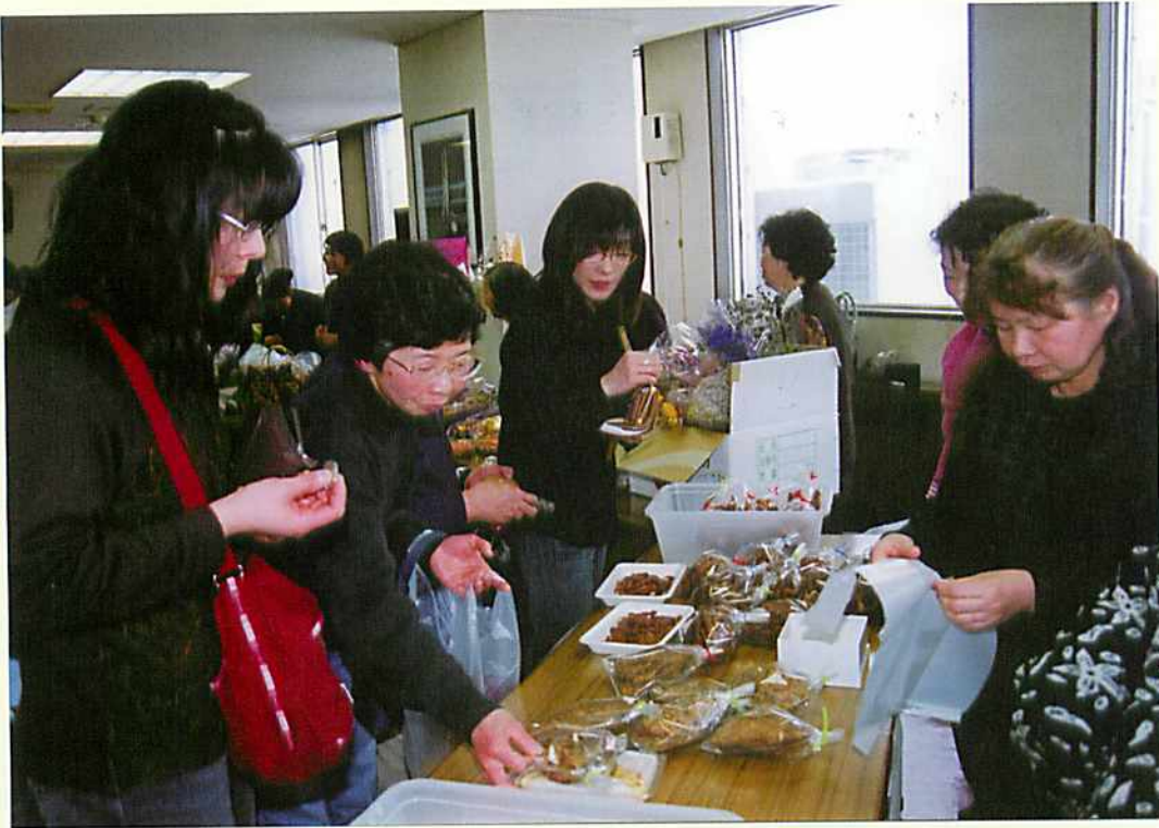
手作りのかりんとうやおせんべいが…

1月20日、農協大会議室において女性部新年恒例会が開 催され、部員80余人が参加しました。