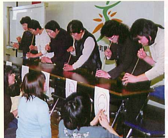
超ロング細穴ストローでの早飲みはキツイ…

が設けられ会場は大賑わい。さて、正午過ぎ一斉に開店した目玉のひとつはショップ。今年は、会場を農協中会議室に移し、地区やグループ、個人など11店が並び、種類豊富な手作りの和・洋菓子類のほか、手芸品、ドライフラワー、おもちゃなどが販売されました。また、今年は、数年ぶりにリサイクルバザーが実施され、たくさんの部員の皆さんから譲り受けた品々を超安価で販売。売上金を新潟中越地震災害義援金としたほか、会場にはスマトラ島沖地震災害募金箱も併設されました。参加した部員はこの時ばかりは財布の紐をゆるめてお買い物。開店から20分程度でどの店も完売しました。