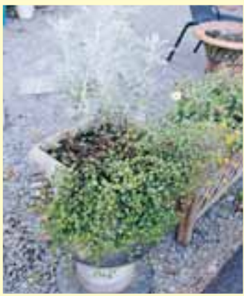
8月号、熱さ対策の例①で紹介した寄せ植え