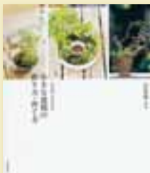
山田 香織 著 定価 1,470円 (税込)

小さな盆栽の作り方と育て方。季節ごとの管理のポイントや栽培法がカレンダー仕立てでひと目でわかるからはじめてでも安心。人気盆栽家の著者が紹介する、繊細で美しい作品は、小さな盆栽の世界を堪能できる。