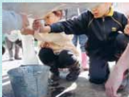
モデルカウ搾乳体験