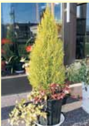
例…ひと回り大きな鉢に植え替え、寄せ植えしたものです。