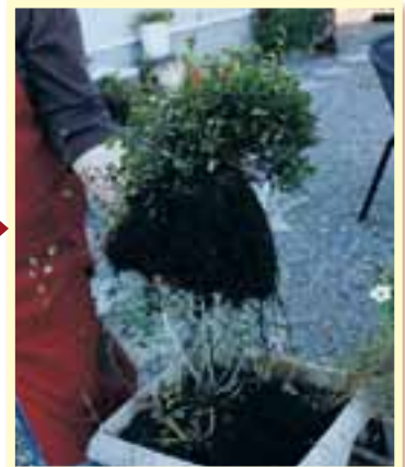
②プランターから掘り出す。

④寒さが強くなる前まではパオパオで覆い、寒さが強くなってからはビニールで覆う。暖かくなり始める頃まで、ハウスの中で越冬させる。