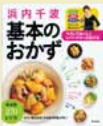
浜内 千波 著 定価 1,470円 (税込)

基本の料理がしっかり身につく。定番料理の「味付け」「素材」「調理法」を少しずつ変えるだけで、たくさんのアレンジメニューも簡単にマスターできる!健康を考えた料理のコツやポイントも満載の270レシピ。