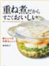
梅崎和子 著 定価 1,365円 (税込)

食材を切って鍋に重ね入れ煮るだけの調理法、重ね煮。炒め物、和え物などさまざまな料理が手早く作れ、素材のうまみがたっぷり引き出される。また、だしいらすず油や調味料が控えられ、低カロリーでヘルシー。