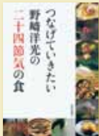
野崎 洋光 著 定価 2,310円 (税込)

野崎洋光氏がふるさとへの思いをこめた、郷土料理のレシピ集。二十四節気にもとづき、その季節ごとの料理や行事を、現地の風景とともに鮮やかな写真で彩る。未来へつなげていきたい東北の姿がそこにある。