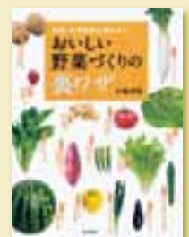
木嶋利男 著 定価 1,785円 (税込)

おいしい野菜ってどんなもの?その容姿の特徴とその理由を解説し、そうした野菜に育てる方法を紹介。農薬も化学肥料も使わずにできる名人ならではの裏ワザが満載。ワンランク上の野菜づくりをめざす人に。