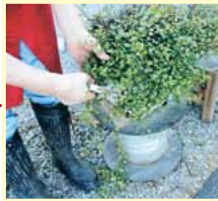
①伸びている部分をカットする。 (神経質にならなくてOK)