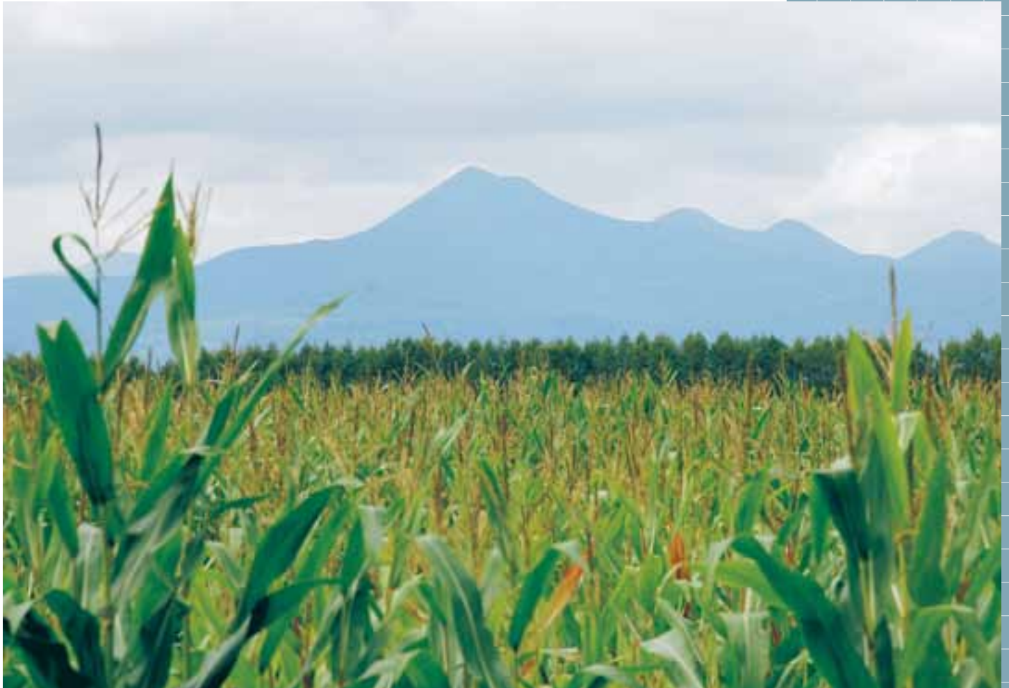
デントコーン畑風景 (2011.10)