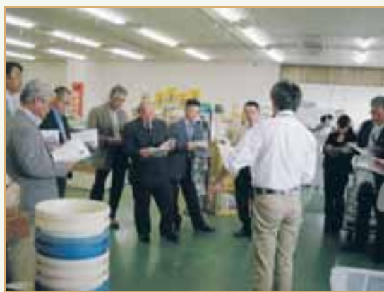
J Aなのはな農産物直売所

11時過ぎ、最初の視察地である富山市に向かいました。1時間半程を要して富山空港に降り、これから4日間お世話になる貸切バスに乗り込みました。昼食はバスの中で富山名物の鱒寿司弁当でしたが、バスガイドの第一声は、鱒寿司の話で、原料のサクラマスが地元では少なくなつており、主に北海道産のものが使用されていることを聞き、旅行に来て我が家の料理を食べている様で、1日目から旅の気分が水を差された感じでした。 程なく最初の視察先のJ Aなのはな農産物直売所に到着しました。直売所見学の後、J A職員の方より説明がありました。運営の目的は直売