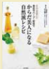
小林妙子・村上志緒 監修 定価 1,365円 (税込)

身近なハーブや野菜を使って作る、料理やドリンクからスキンケア用品、常備薬までの48レシピを紹介。自然の素材を持つパワーで、からだの内側と外側からとのえれば、すこやかできれいになれる。