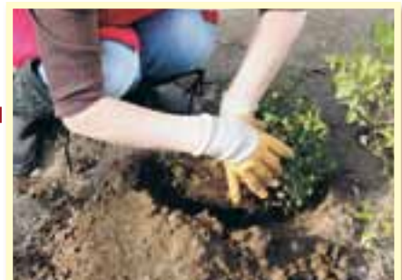
③ハウスの中の土に移し、水を与える。