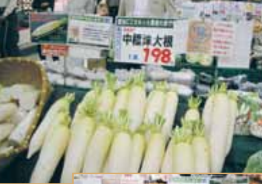
フレッシュフーズ駿河屋

も恵まれ全員無事踏破することが出来ました。また、大自然の中に作られた現代土木工学の粋を集結したダムの姿に感嘆し、ロープウェイから紅葉した山なみを眺望し、暫し視察研修の緊張をほぐすことが出来ました。最後のケーブルカーを降り、再びバスに乗って、岐阜県高山市に向かいました。どこまで行っても車窓の両側に山が迫るV字谷、片側に溪流を見ながら3時間、ようやく少し視界が開けてくると高山市街が見えて来ました。高山市では、J A 中標津の大根・ブロッコリー・乳製品を販売しているフレッシュフーズ駿河屋の本店を視察しました。駿河屋は昭和8年の創業で、昭和40年に株式会社を設立し、高山市中心部に5つの店舗があり、他に精肉部門、食品加工部門、業務用販売部門など、食品関連の販売を幅広く展開しております。売上高は63億円となっています。