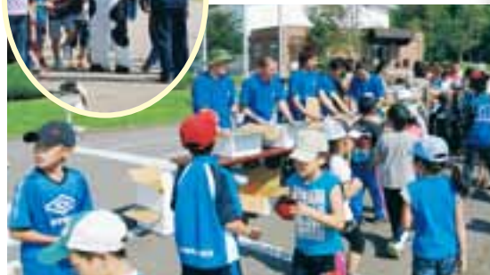
なかしべつ牛乳を提供

9月28日、丸山小学校30周年記念「丸っ子収穫祭」が開催されました。今年も、30周年記念事業で防獣ネットを設置したお陰で、鹿の被害がほとんどなく、例年よりも大きないもがたくさん収穫できました。 午前中は、児童と一緒に「○×クイズ」を行い交流を深めました。昼には伝統の丸山太鼓を披露していただき、その後に児童が作ったカレーと保護者が作った「いも団子汁」などを美味しくいただきました。青年部からは牛乳をプレゼントしました。牛の着ぐるみ2頭は児童にもみくちやにされていただけ、とても充実した収穫祭でした。