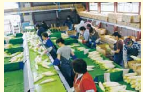
選果梱包作業風景

栽培農家の皆さんの取り組みで、北海道特別栽培の「yes clean」として打ち出すことができるということは、生産農家に偏らない品質の均質化が保たれるということ。バイヤーの方々の求める安心・安全はもとより、安定した品質、間違いの無い品質で出荷後に、販売者の手元に届くようにするのが何より重要になります。