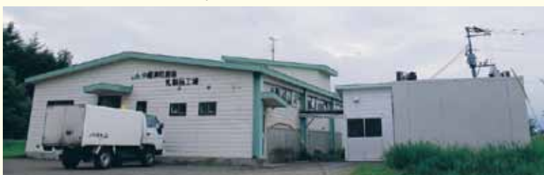
乳製品工場は増強工事で業務に弾みを