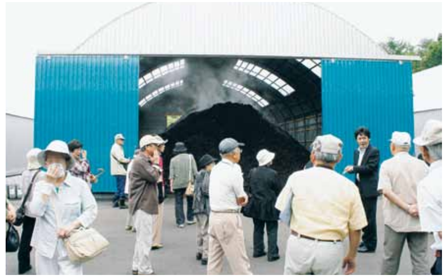
廃棄物が利用されて商品になることでECOを実感

ています。木質系資材が手に入りにくいところもあるのですが、この取り組みを知ることによって廃棄物が肥料になる過程を知り、くさいくさいと覆っていた鼻からハンカチを取る参加者も見られました。