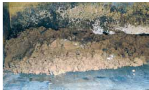
乳製品の工場から出る廃棄物残さ

ます。市民団体なので市町村全てにあるわけではありません。中標津町消費者協会は平成元年に発足して今年で22年の歴史ある団体となります。会員数が270名ほどで組織されており、賛助会員として企業などからの支援も得ています。