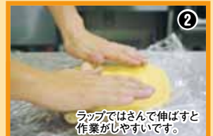
ラップではさんで伸ばすと作業がしやすいです。