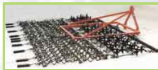
パスチャーハロー

パスチャーハローなどをかけることで、前年秋や春に散布した堆肥やスラリー、前年の枯れ草が収穫時に混入するのを防止する事ができます。パスチャーハローの代用として、タイヤやチェーンで自作している事例もあります。