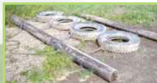
自作タイヤハロー

また雑草が多い場合は、除草剤散布します。効果的な利用のために刈り取り、更新計画をたてましょう。