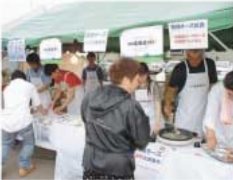
雪印乳業チーズ試食とワイン販売