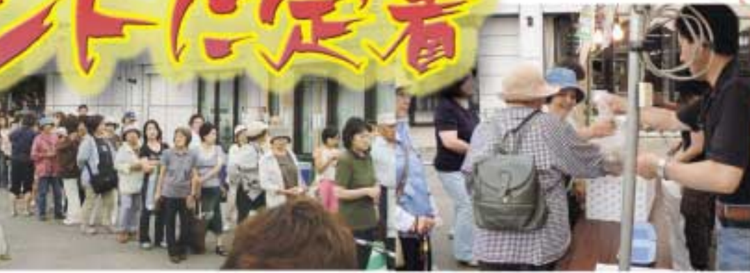
あるでのお買物3,000円に1枚渡された福引き券抽選をする人達の長蛇の列