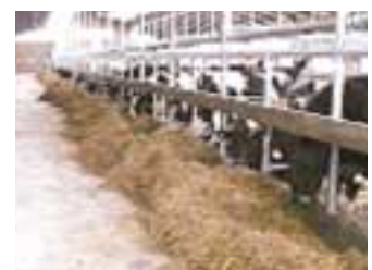
常にエサがある状態に！

気温の低くなる夕方以降に新鮮なエサを与えることや給与量を増やすことも効果があります。 放牧地に日陰がない場合は日中に放牧せず夜間放牧を行うことも1つの方法です。