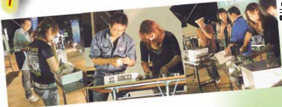
おいしいホットケーキづくり。 3チームの出来栄は？