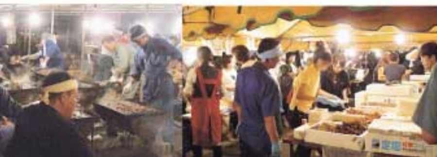
テント内は大忙し