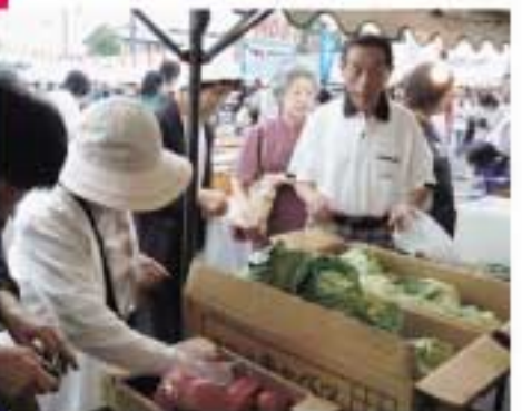
新鮮でとれたての大きな野菜が 大好評でした。(農産販売課)