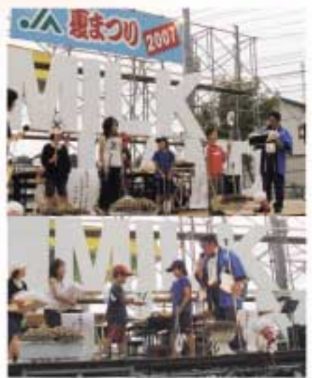
小学生対象の ×クイズ

もうすっかり夏の定番行事として、組合員の皆さまならびに町民へ浸透した農協の夏まつりが7月27日に開催されました。 今年も金融店舗前駐車場を会場に、午後5時の花火の合図前から多くの方にご来場いただき、お祭りがスタート。天気もほどよく、大変多くの方に楽しんでいただけたのではないかと思います。ご協力いただいた、関係各位にはまことにありがとうございました。