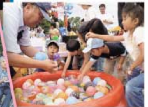
ヨーヨー釣りに子どもたちも大はしゃぎ