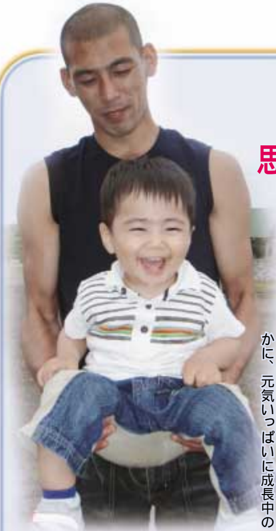
パパが小さいころにそっくりネ