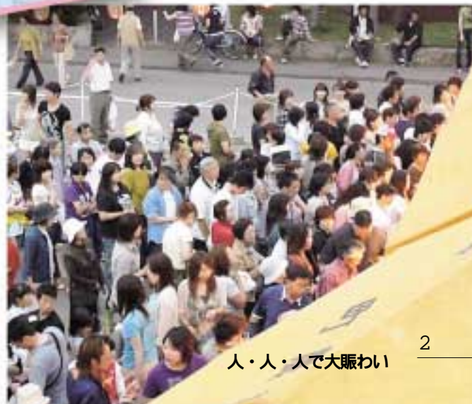
人・人・人で大賑わい