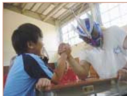
ホッカイブシドー選手

最後は、記念撮影やサイン 攻めでレスラーをタジタジに しました。夏休みの思い出に なったかな?