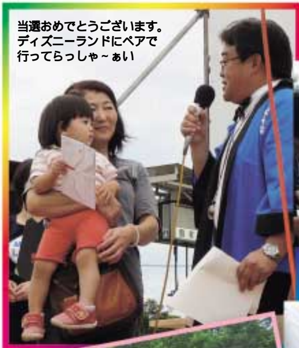
当選おめでとうございます。 ディズニーランドにペアで 行ってらっしゃ〜あい