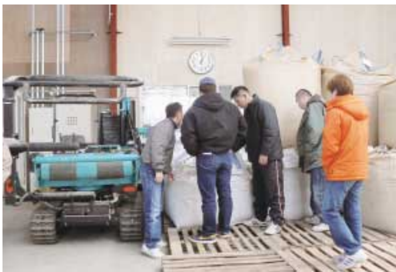
岡部副部長(左端)も丁寧に説明してくれました

青年部員にも同社のTMRを供給していけると思つたお声を掛けていただき、飼料購入チャネルが1つ増えた貴重な研修会となりました。