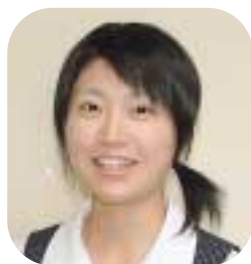
係員生活店課舗生活店購買部