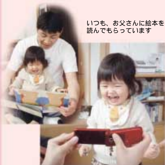
携帯電話の自分の動画を見て喜んで 天ちゃん