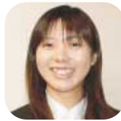
生産部 酪農課 酪農課係

4月2日に行われた職員歓送迎会の前段、永年勤続者表彰として、当農協と道中央会より賞状と記念品が手渡されました。昭和48年に入組し生活部生活店舗へ配属。以後、金融、共済、資材課などを歴任して資材係長として退組されました。