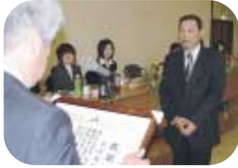
購買部 営農資材課 生産資材係長

e-mail: keieikikaku@ja-nakashibetsu.or.jp