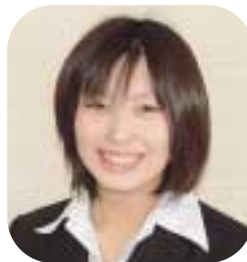
生産部畜産販売課畜産販売係

かりですが、皆さんが優しく接して下さい、私も早く仕事に慣れて明るく一生懸命頑張っていきたいと思う毎日です。何かとご迷惑をおかけしてしまいかもかもしれませんが、向上心を持って笑顔で仕事に励みますのでよろしくお願いいたします。