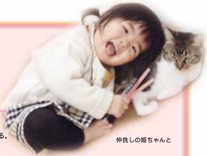
仲良しの姫ちゃんと