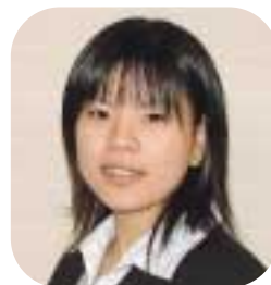
管理部管理電算課管理電算係

です。仕事内容はもちろんですが、組合員さんの顔と名前を早く覚えたいと思っておりますので、ご来組の際にはぜひ声をかけていただきたいです。