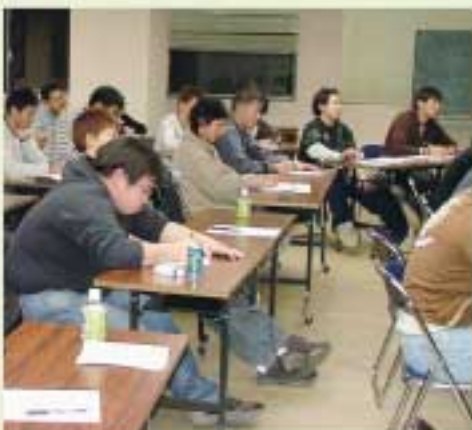
参加者も真剣にメモ、メモ！

JA中標津青年部員は、中標津町の若手農業経営者としてがんばっていきましょう！最後に、今回の講演にご協力いただいた、道東酪農ヘルパーネットワークサービス（D net）の方々に深く御礼申し上げます。このセミナーの模様についてはJAなかしべつ公式WEBでも確認いただけます。