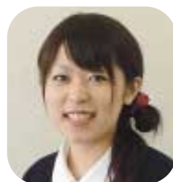
係員生活店課舗生活店購買部

いです。色々ご迷惑をお掛けしてしまつこともあるかと思ひますが、どうぞよろしくお願ひします。