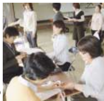
血糖値を測定しているところ。 ドキドキ...