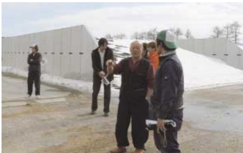
部員の質問に答える長瀬社長(中央)